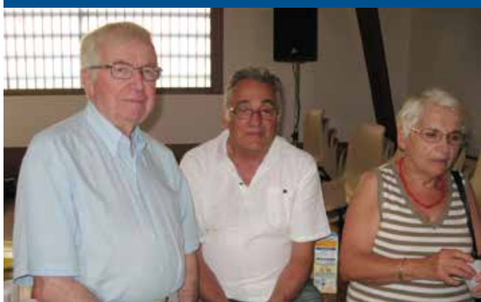
Les moirannais présents

L'Union pour la Défense des Associations de l'Isère (UDAI) a organisé à Apprieu le 15 juin 2013, l'assemblée générale de la FFBA, dont c'était le 30 e anniversaire. Une trentaine d'associations étaient présentes dont deux associations Moirannaises (Club des Baladins et Moirans de tout temps).