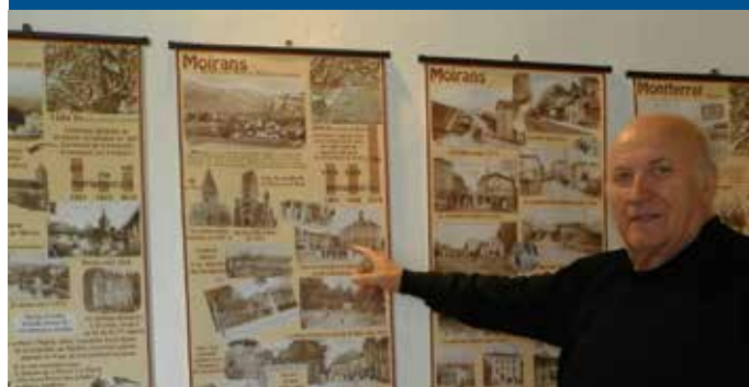
Le président devant le panneau de Moirans