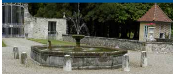
La fontaine à l'entrée du château