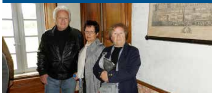
Des adhérents dans la salle de réception