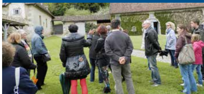
Le groupe attentif au guide