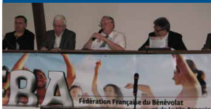
Tribune des officiels

mêmes besoins. Les dirigeants de la FFBA sont déjà responsables d'associations de base. Ils y occupent des fonctions diverses (présidents, secrétaires, etc...). Actuellement la FFBA regroupe plus de 15 000 associations, est structurée en Unions Régionales, Départementales et Relais Locaux, et est présente dans 11 régions sur 22. Est reconnue de mission d'Utilité Publique (Journal Officiel du 28/08/2002). Totalement indépendante, la FFBA rassemble des associations de toutes disciplines, du sport à la culture, de l'humanitaire aux loisirs. Elle n'intervient pas dans les domaines spécifiques réservés aux fédérations, mais traite les thèmes généraux et les problèmes de tous les jours se posant aux bénévoles et aux associations. Une volonté affirmée: « Née de la base, au service de la base » Et pour remplir ses missions, l'application d'une devise: « L'union fait la force ».