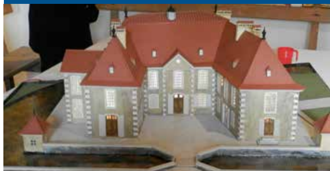
Maquette du Château

Voici quelques photos retraçant cette journée.