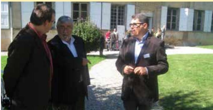
Le Président de la FAPI en grande discussion